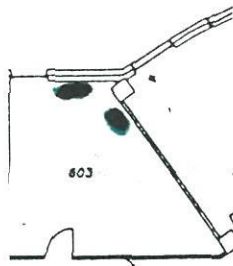
План размещения приборов и оборудования